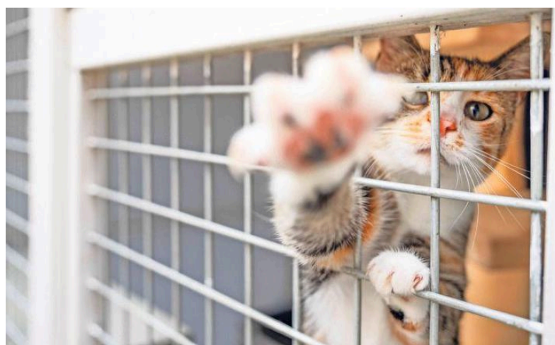
De camera van de fotograaf ziet eruit als een leuk speeltje.

Het adres van Kattenpension Silvestris is: Alkmaarseweg 19, 1775 PR in Middenmeer. Tel: 0227-502787 / 06-23735254. Email: info@kattenpensionsilvestris.nl Voor één kat betaal je voor een suite met buitenverblijf 38 euro. Een binnenkamer zonder buitenverblijf kost 28 euro per dag. Voor meerdere katten uit één gezin zijn de tarieven anders, afhankelijk van het aantal katten. De prijzen zijn te vinden op de site van Silvestris. www.kattenpensionsilvestris.nl Op de site is onder het knopje 'Reserveren' te zien wanneer er nog plek is dit jaar.